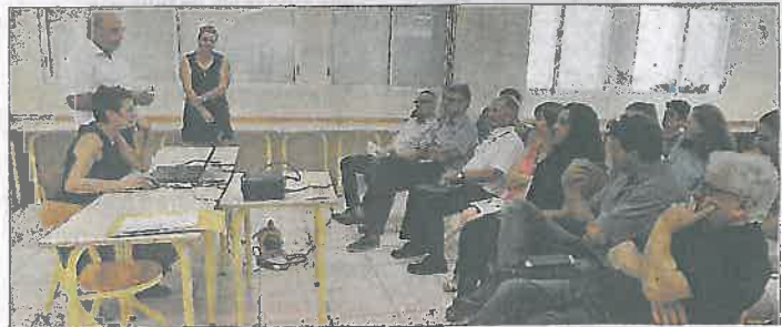
Le projet « Europe We Can » : une expérience riche et porteuse d'avenir.