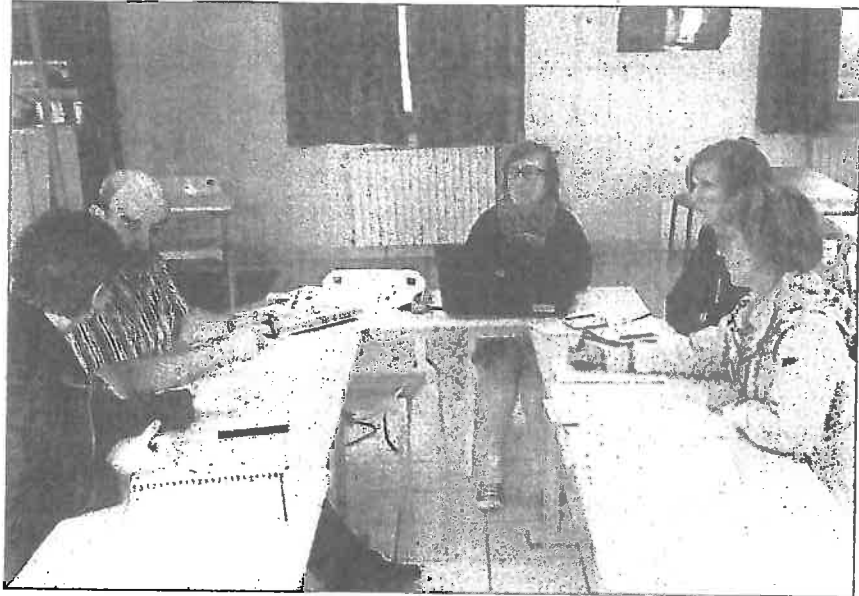
Responsables du lycée de Porec et de F.Marty ont peaufiné le projet.

Des chèvres, de l'agrotourisme et une belle envie de travailler ensemble, il n'en fallait pas plus au lycée Balote de Porec en Istrie (Croatie) et au lycée François Marty pour donner vie à un partenariat au cœur de la ruralité européenne qui vise à créer un modèle de démarche de développement local qui intégrera leur formation pédagogique tout en servant les professionnels de la filière caprine. Ce projet déposé auprès de la Commission européenne dans le cadre des échanges Erasmus a été validé.